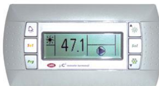
Complete remote control

Οι παραπάνω τιμές επιβαρύνονται με ΦΠΑ. Η εταιρεία διατηρεί το δικαίωμα αλλαγής τιμών – στοιχείων χωρίς προειδοποίηση