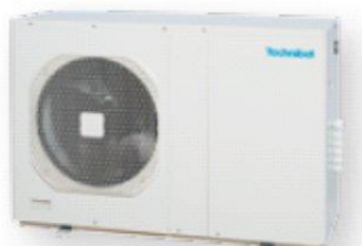
AQUASET 6 et 9