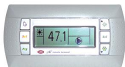
Complete remote control