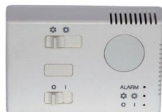
Simplified Remote control