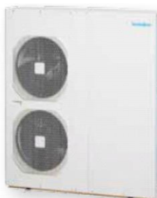
AQUASET 20 et 24